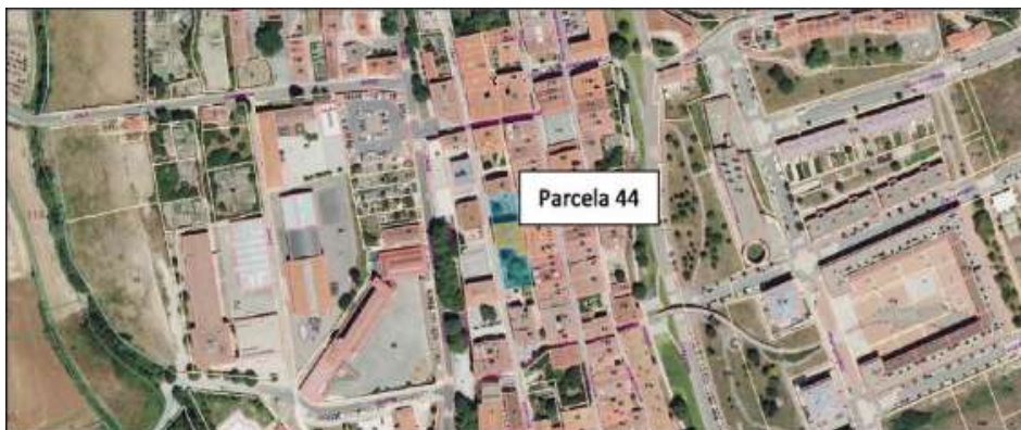
Referencia a la parcela 44 sobre planimetría de Arabako Katastroa.