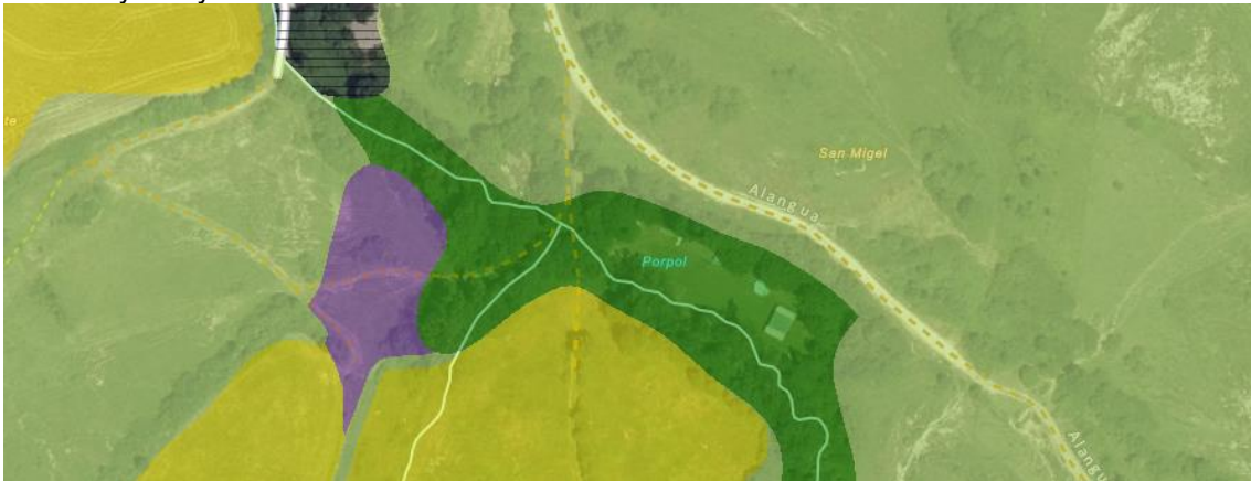
PTS Agroforestal

La parcela se encuentra en suelo no urbanizable con zonificación D50 de Zona de Protección de los Ríos y Arroyos.