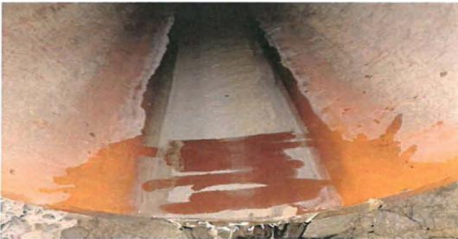
Fotografía del interior del colector de pluviales en el punto de vertido.

IV.- La Agencia Vasca del Agua realizó diversas inspecciones centradas en el polígono industrial. Concretamente, durante la visita efectuada el 25 de enero de 2024 se examinó el punto de vertido sobre la margen izquierda del río Eguileor (coordenadas UTM30 ETRS89 X: 549790 e Y: 4743788) del colector que recoge las aguas pluviales de la zona oeste del polígono, observándose un sedimento blanquecino en la base de la conducción.