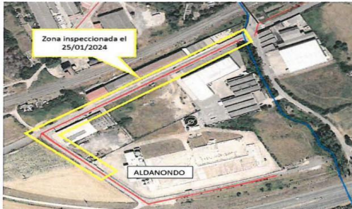
Zona inspeccionada en la visita del 25 de enero

Al llegar a la esquina de la red de pluviales, se incorporó a la visita la Concejala de Medio Ambiente del Ayuntamiento de Salvatierra / Agurain. Un vecino informó de que el martes día 23 de enero entró en las instalaciones abandonadas de la fábrica de Aldanondo Corporación Alimentaria SL en la parcela 230 del polígono 5 (incendiada en 2018), y que vio varios contenedores tipo GRG (1m3) con un rastro blanquecino a su alrededor y sobre un sumidero de pluviales, mostrando una fotografía.